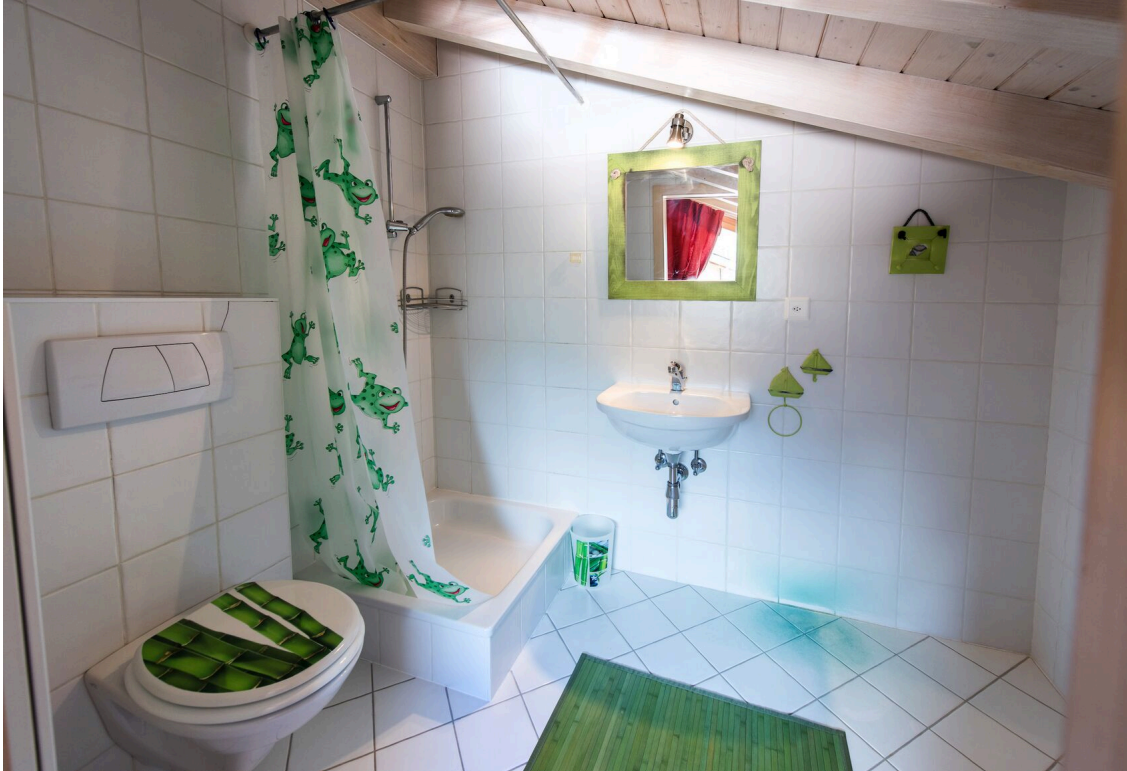
salle de bain