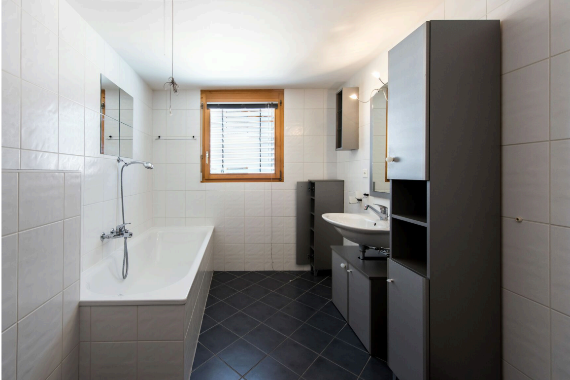
salle de bain