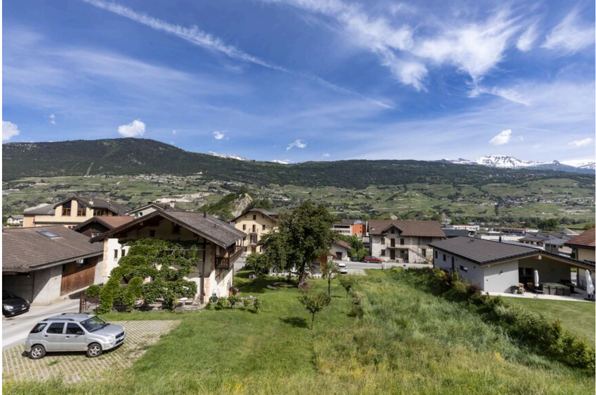
Vue depuis chambre principale étage