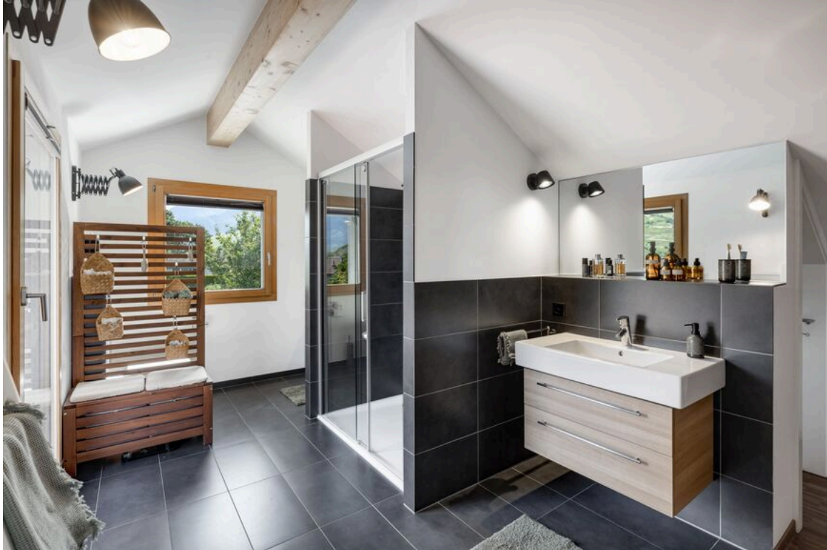
Salle de bain privative avec accès au balcon