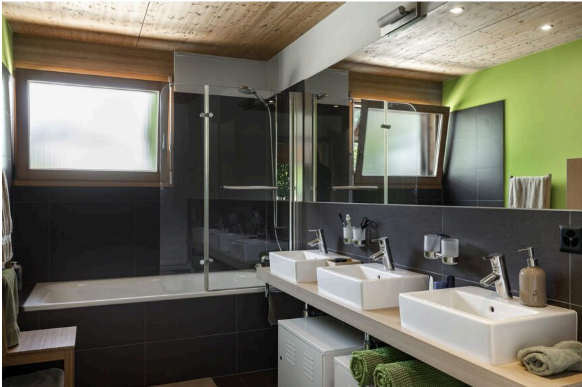
Salle de bain-WC