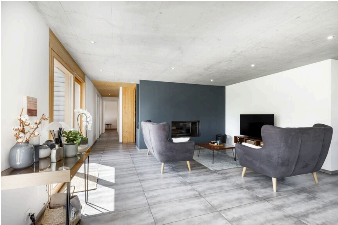
Séjour avec cheminée traversante