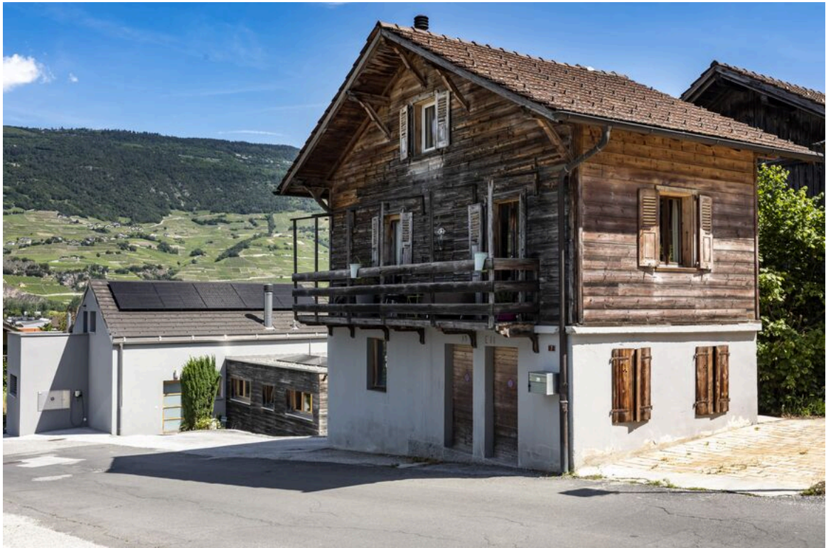
Petite chalet indépendant