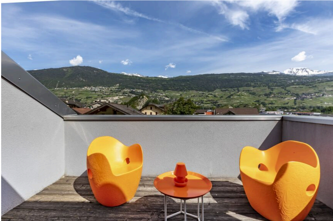
Balcon étage donnant sur salle de bain privative