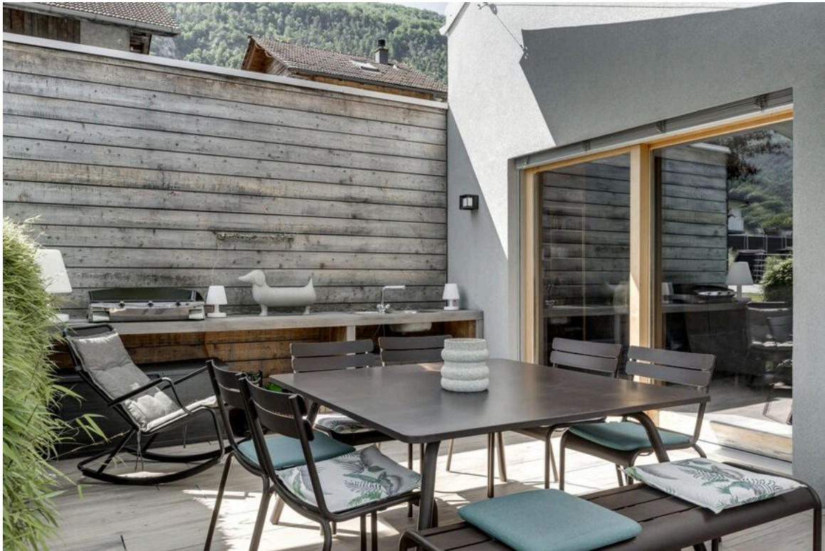
Espace kitchenette extérieure