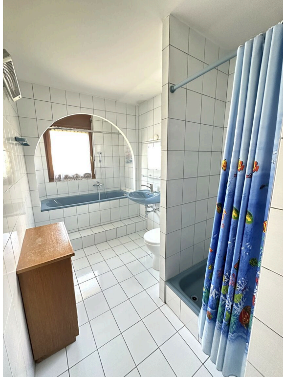
salle de bains