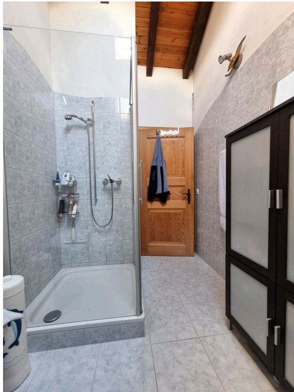
salle de bains