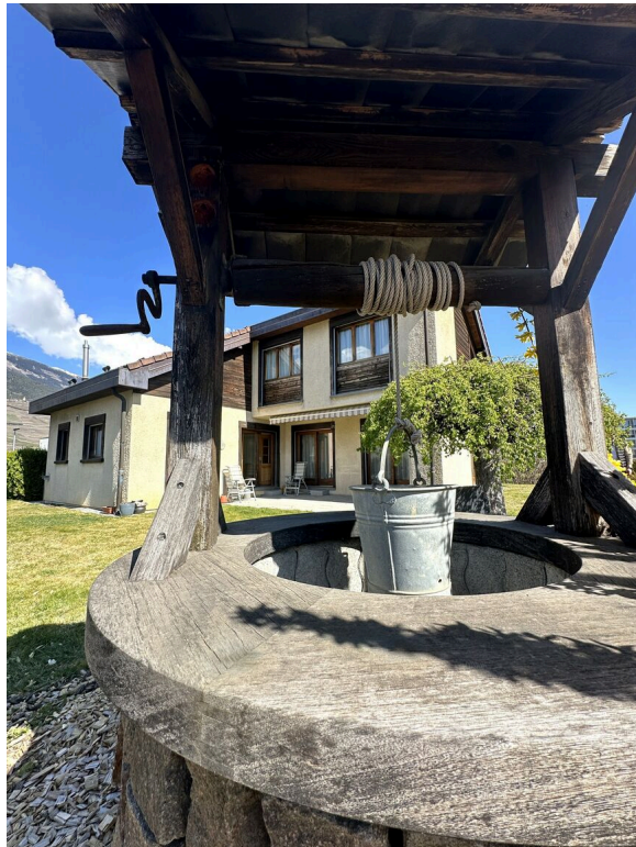
puit et maison