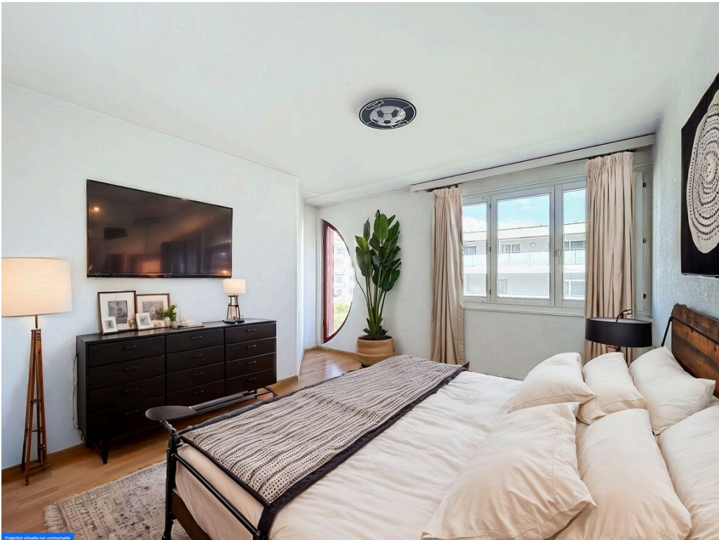
Chambre 1 ameublement virtuel