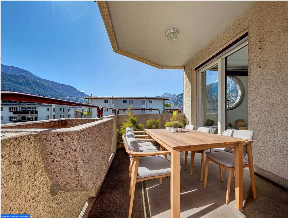
Balcon ameublement virtuel