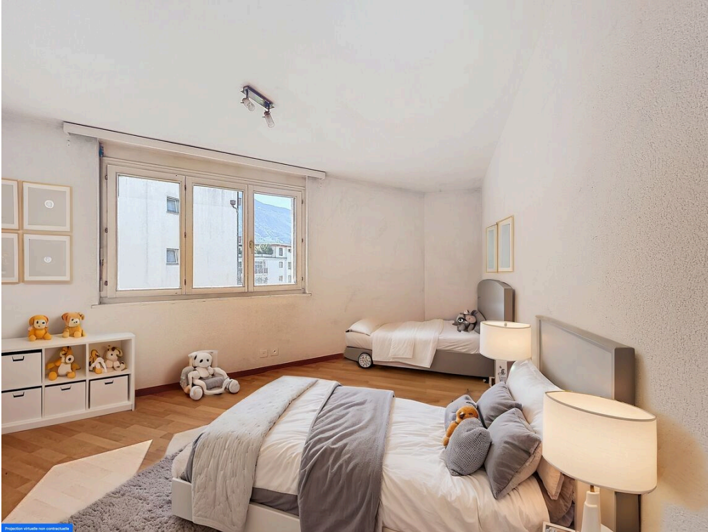
Chambre 2 ameublement virtuel