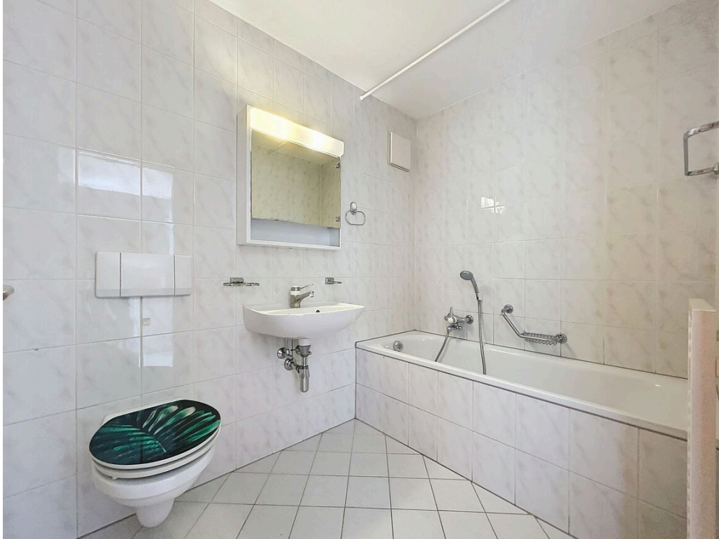
Salle de bain