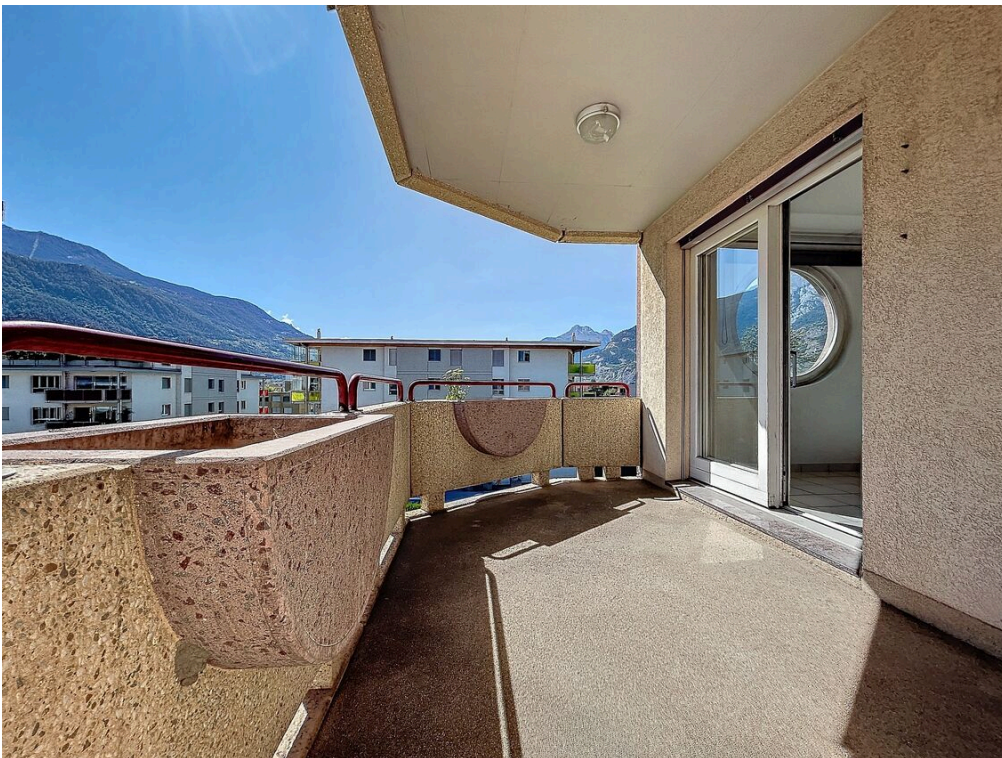
Balcon vue sud-ouest