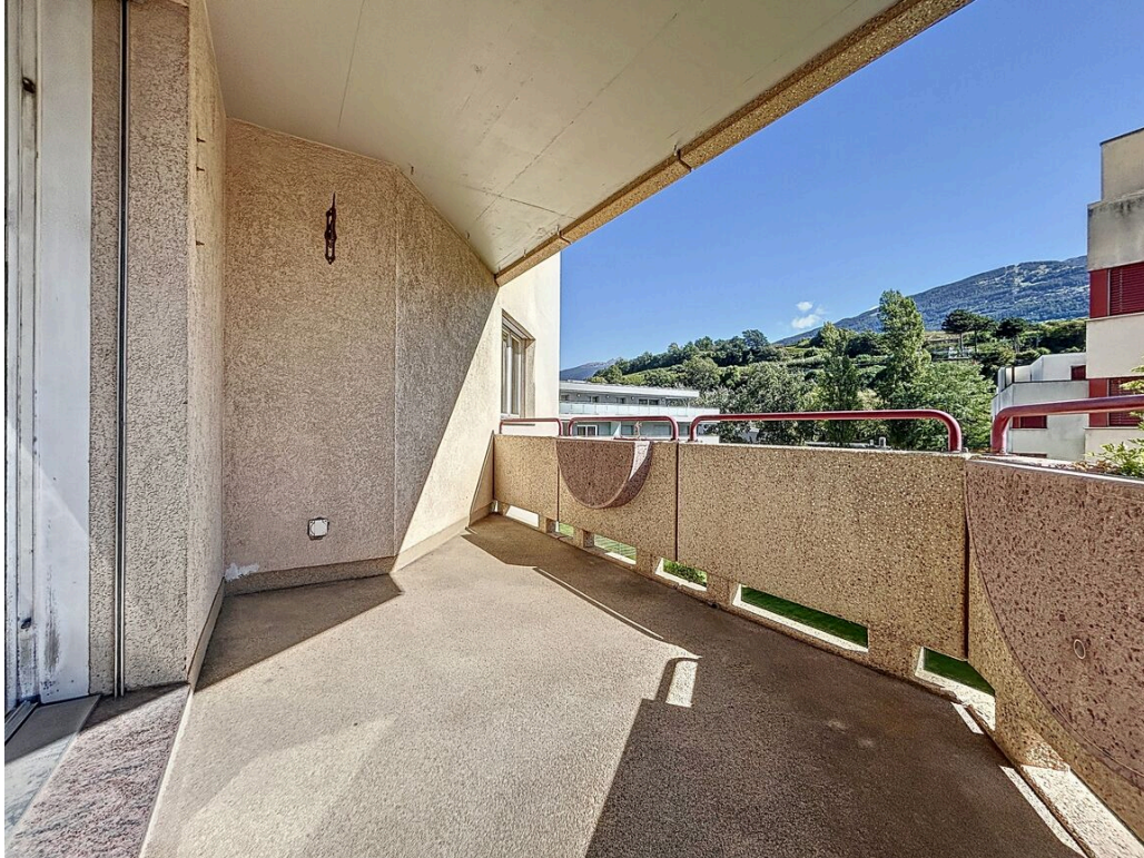
Balcon vue sud-est