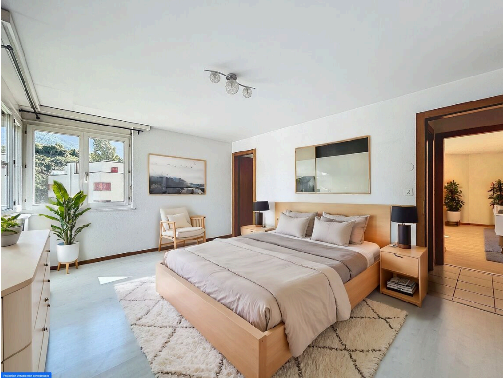
Suite parentale ameublement virtuel