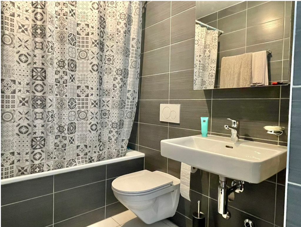
salle de bain