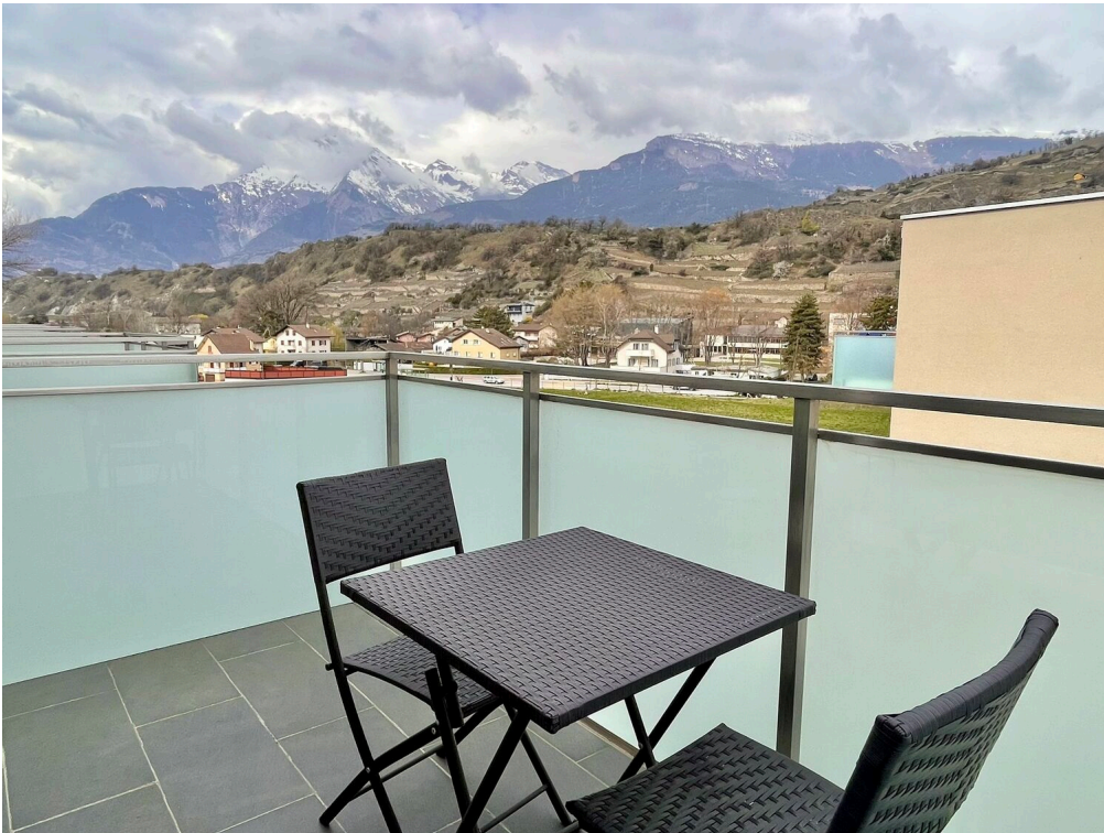
balcon avec vue