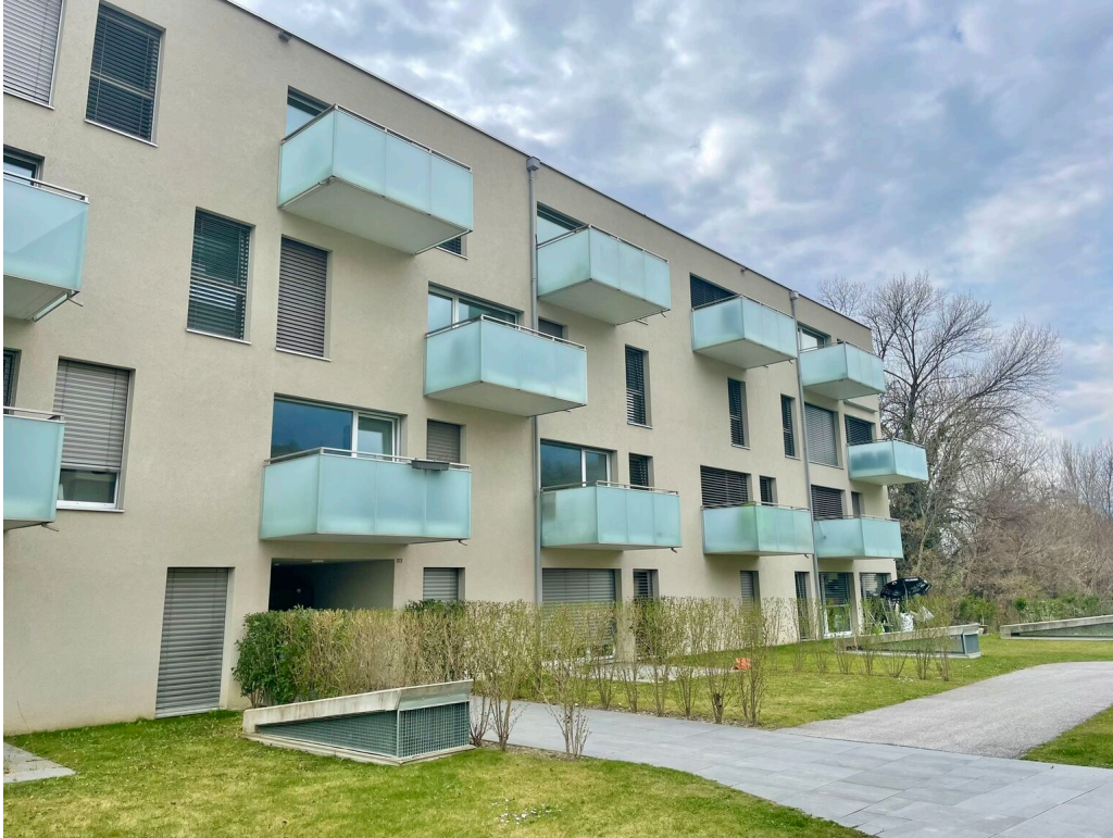
appartement au 3ème étage