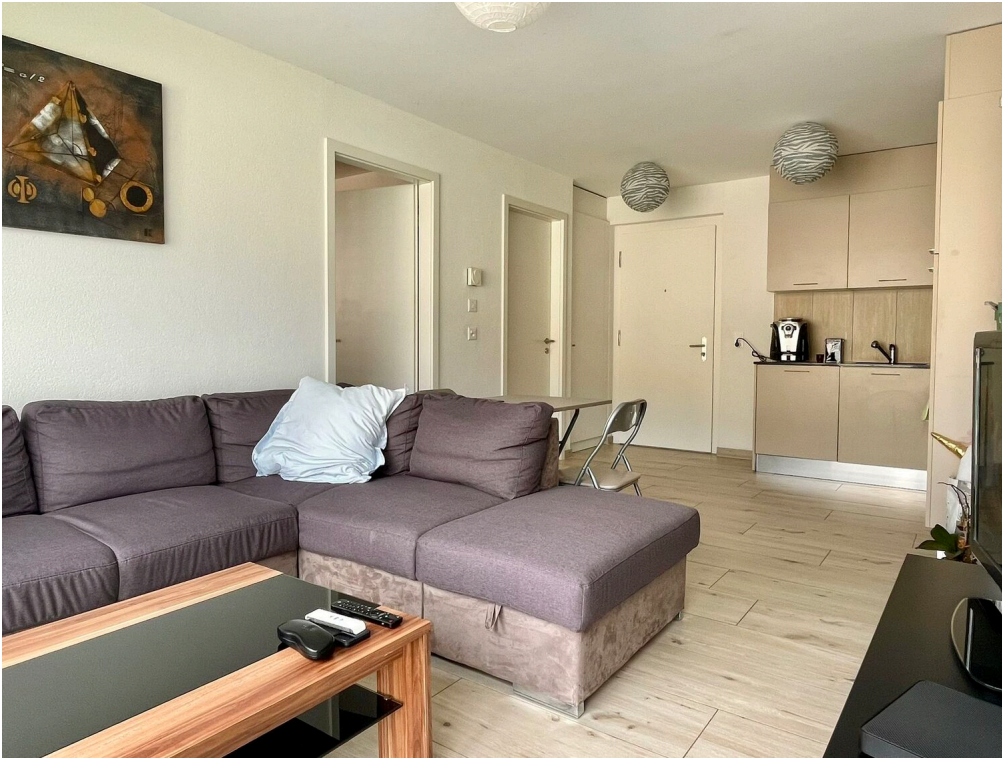
séjour et cuisine